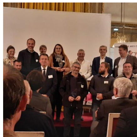
En 2021 la FFB 37 a lancé un concours parmi ses adhérents. Les trophées ont été remis aux entreprises méritantes

En 2021 la FFB37 a cherché à promouvoir la démarche RSE parmi ses adhérents en mettant en place un concours dont les trophées ont été décernés à l'issue de son l'assemblée générale.